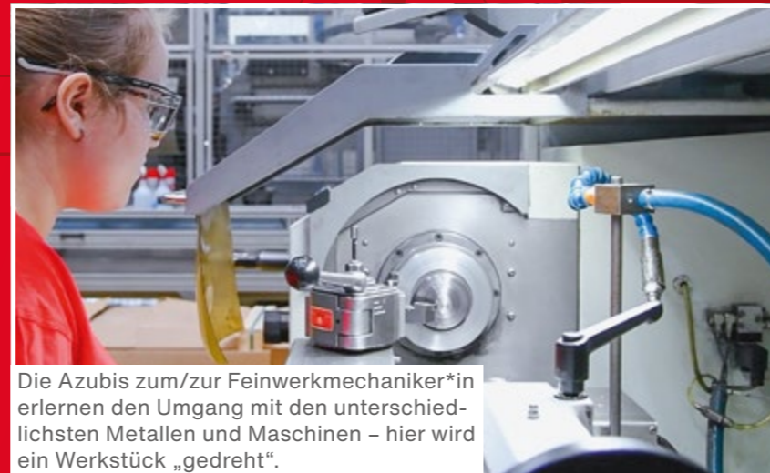
Die Azubis zum/zur Feinwerkmechaniker*in erlernen den Umgang mit den unterschiedlichsten Metallen und Maschinen – hier wird ein Werkstück „gedreht“.