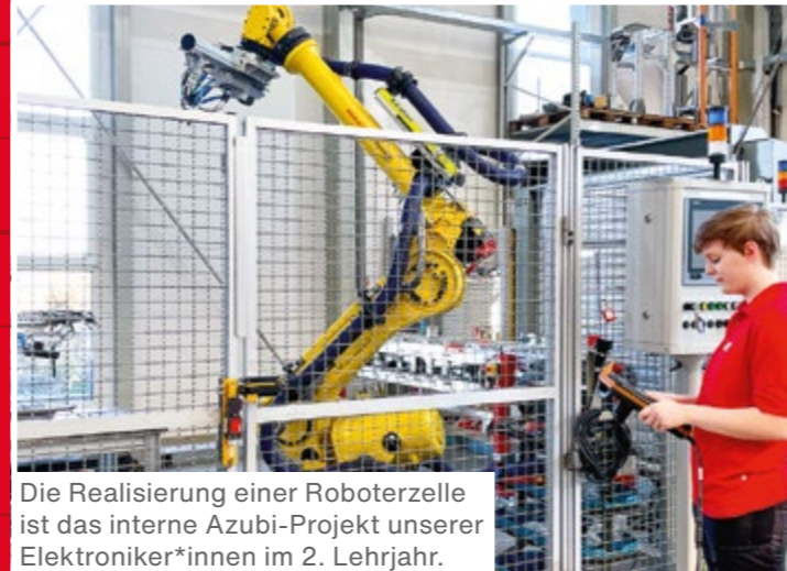
Die Realisierung einer Roboterzelle ist das interne Azubi-Projekt unserer Elektroniker*innen im 2. Lehrjahr.