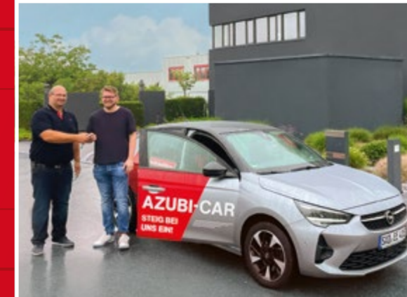
„E-Power“ für die FEE-Azubis! Der Schlüssel unseres „Azubi-Cars“ wurde im September 2023 erstmals an einen Auszubildenden übergeben.