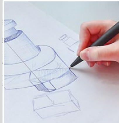
Händische Zeichnungen sind Teil der Ausbildung zum/zur Technischen Produktdesigner*in.