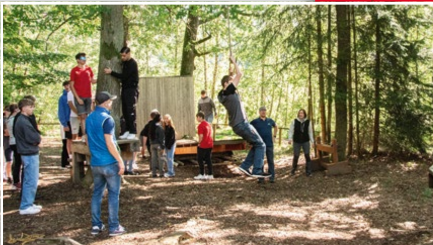
Die „neuen“ Azubis in Aktion beim Team-Building-Event im Niederseilgarten.