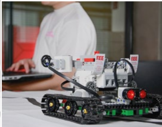
Ein „LEGO MINDSTORM Roboter“ wird von Auszubildenden und dual Studierenden im Informatik-Bereich programmiert.