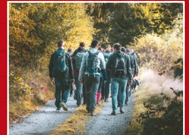
Alle Kolleg*innen können sich jährlich u. a. auf einen FEE-Wandertag und -Winterausflug freuen!