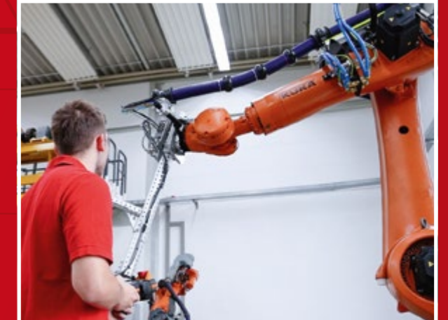
Die dual Studierenden im Studiengang „Mechatronik“ lernen u. a. das Roboter-Programmieren.