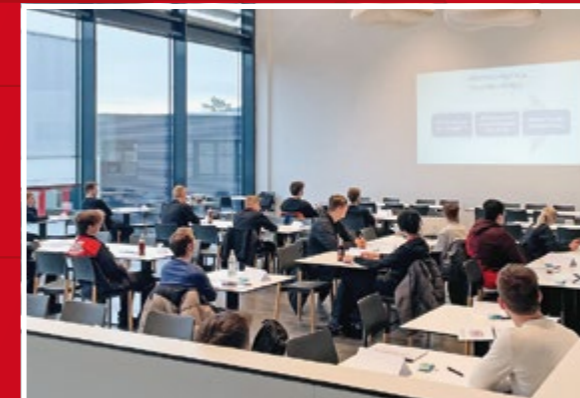
Die Azubi-Seminare „Business-Knigge“ und „Fit für die Prüfung“ bereiten unsere Auszubildenden auf den Geschäftsalltag im Unternehmen und die anstehenden Abschlussprüfungen vor.