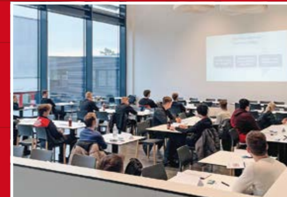
Die Azubi-Seminare „Business-Knigge“ und „Fit für die Prüfung“ bereiten unsere Auszubildenden auf den Geschäftsalltag im Unternehmen und die anstehenden Abschlussprüfungen vor.