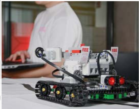
Ein „LEGO MINDSTORM Roboter“ wird von Auszubildenden und dual Studierenden im Informatik-Bereich programmiert.