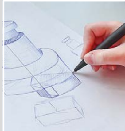
Händische Zeichnungen sind Teil der Ausbildung zum/zur Technischen Produktdesigner*in.