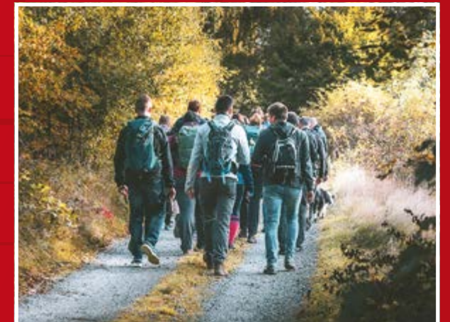
Alle Kolleg*innen können sich jährlich u. a. auf einen FEE-Wandertag und -Winterausflug freuen!